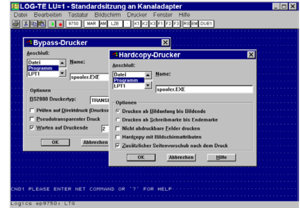
LOG-TE9750 unterstützt Hardcopy-, Bypass und Stationsdruck

LOG-TE unterstützt Hardcopy-, Bypass- und Stationsdruck. Beim Hardcopy wird der aktuelle Bildschirminhalt als Druckjob ausgegeben. Beim Bypass- und Stationsdruck steuern